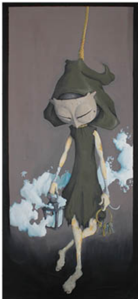
JOSÉ GABRIEL BAUZÓ LLANES (Puerto Rico) Asfixié , 2010 Acrylic on canvas, 47½" x 20"